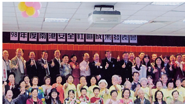
中華科大建築工程系所實務與理論並重，積極安排學生參與社區規劃中心實習，培養學生的實務經驗，此為參與南港安全社區規劃的大合照。

由於陳宗鵠在美國設計監造多棟太陽能房的省能建築，因此被工研院葉玄院士聘請回來主持節能建築研究，當時台灣剛開始做這方面的研究，所以綠建築、節能建築創造，他也是開創者之一。他表示，雖然在此方面台灣的起步較慢，但這是未來的建築趨勢，因此籌設中華科大建築工程與環境設計研究所時，一開始所設定的目標就是以永續發展、健康的綠建築及環境為主軸核心，而且教育學生當然是教世界未來潮流的新技能，除此之外，還要將開業期間所碰到頭破血流的經驗傳承給學生，減少他們挫折的機會。