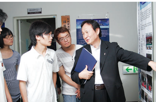
畢業展可以激發學生的潛力，作品也可作為以後開發的參考藍圖。